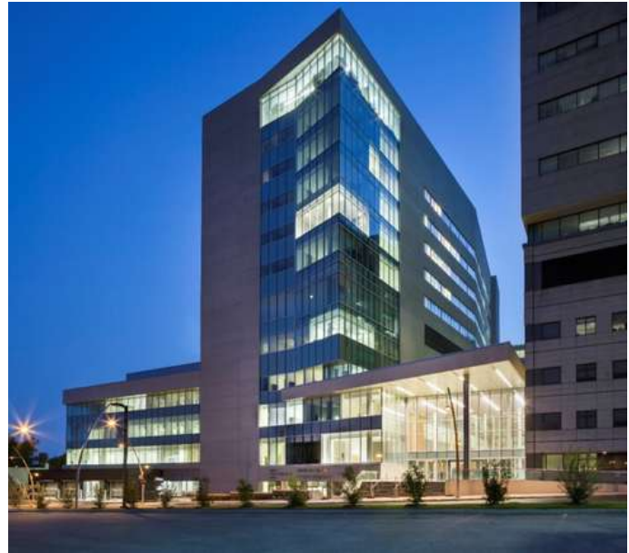
Pavillon K de l'Hôpital général juif

Pour ce faire, les services du consultant Arup Inc. ont été retenus et l'étude