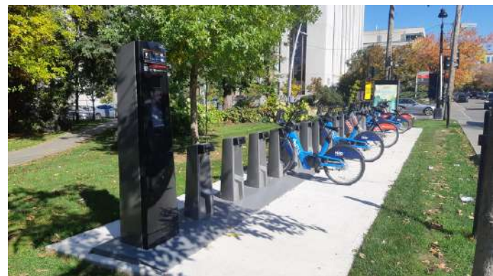
Station Bixi électrifiée à l'Hôpital général juif

Un tarif préférentiel est également disponible auprès de l'Autorité régionale de transport métropolitain (ARTM) et de la Société de transport de Montréal pour les employés du CIUSSS et/ou les employés de l'Hôpital général juif qui se