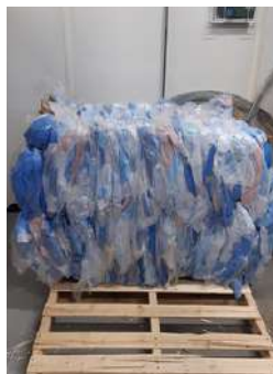
Recyclage de champ bleu à l'Hôpital Pierre-Boucher