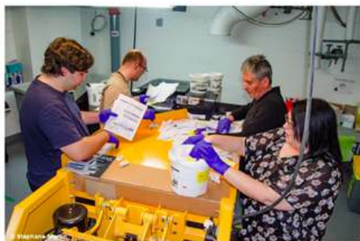
Stagiaires du plateau de travail du CIUSSS Montérégie-Est

Ce projet s'inscrit dans un projet plus large de rénovation du quai souillé et d'optimisation de l'espace dédié à la gestion des matières, notamment par la construction d'une extension au bâtiment (Écopack) dédiée à la mise en ballots et l'entreposage des matières.