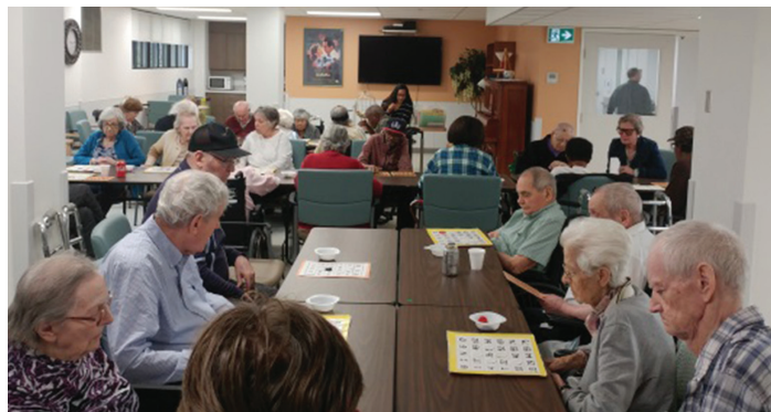
Residents enjoying a bingo game in the new recreation room

PABs (orderlies) have been actively involved in recreation by encouraging residents to attend activities of their choice, portering those residents who need help getting to the recreation room and have also been present during activities. "The PABs are helping generate enthusiasm and interest in the residents' enjoyment of our activities," Miss Waugh says.