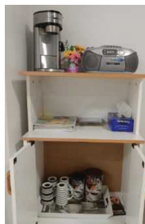
Le chariot de compassion mobile au Centre résidentiel Henri-Bradet

Le comité CMV a joué un rôle essentiel dans l'implantation du chariot de compassion mobile conçu pour reconforter les familles des résidents en fin de vie (voir la photo). Le comité a également appuyé la création de la superbe murale, peinte par les résidents, dont les panneaux ont été montés dans chaque unité.