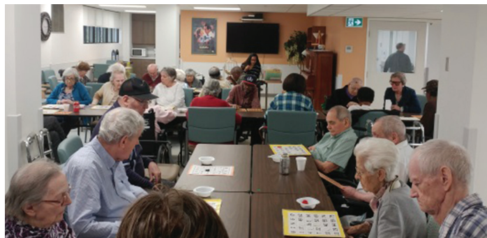
Des résidents s'amuse en jouant au bingo dans la nouvelle salle de séjour

Les préposés aux bénéficiaires (PAB) ont appuyé activement les loisirs en encourageant les résidents à participer aux activités de leur choix et en assurant le transport des résidents qui avaient besoin d'aide pour se rendre à la salle des loisirs. Les PAB ont également été présents pendant les activités. « Les PAB stimulent l'enthousiasme et l'intérêt des résidents