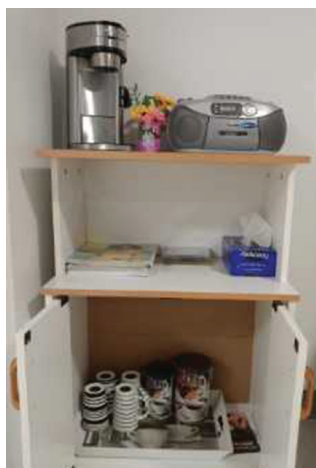
The Henri Bradet Compassionate Cart

The Milieu de Vie Committee is an interdisciplinary team made up of residents, volunteers, and family members. The MDV committee meets at least 4 times a year to discuss and implement a variety of projects to help improve the physical environment and quality of life for our residents. The objective is to ensure a homelike atmosphere at Henri Bradet.